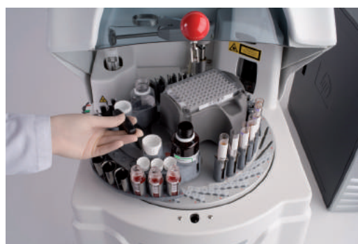
Carrossel removível para reagentes

O Swing é compatível com todas as leitoras Bio-Rad e pode também ser utilizado separadamente. Isto permite customizar o seu laboratório de acordo com as necessidades atuais e futuras.