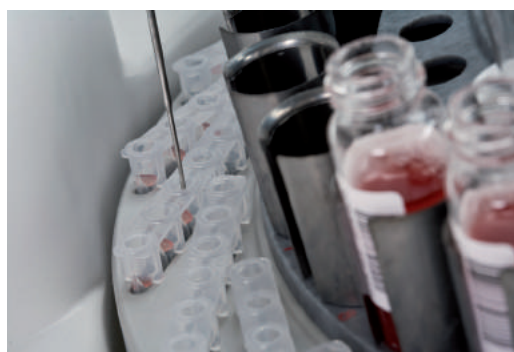
Pipetagem de ID-Cards

Seguindo precisamente os protocolos de testes seleccionados, o Swing padroniza as suspensões de hemácias e os volumes a serem pipetados.