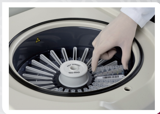
Inserindo um ID-Card

O software validado do Saxo garante leitura e interpretação objetiva e padronizada, independente da avaliação do usuário.