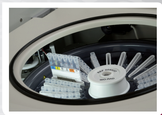
Leitura do ID-Card

Basta carregar o equipamento com 24 ID-Cards e iniciar o ciclo. A centrifugação e leitura dos ID-Cards serão realizadas automaticamente.