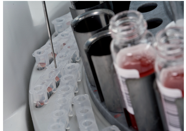
Pipetagem de ID-Cartões

O Swing é compatível com o Saxo e Banjo, e pode também ser utilizado separadamente. Isto permite customizar o seu laboratório de acordo com as necessidades atuais e futuras.