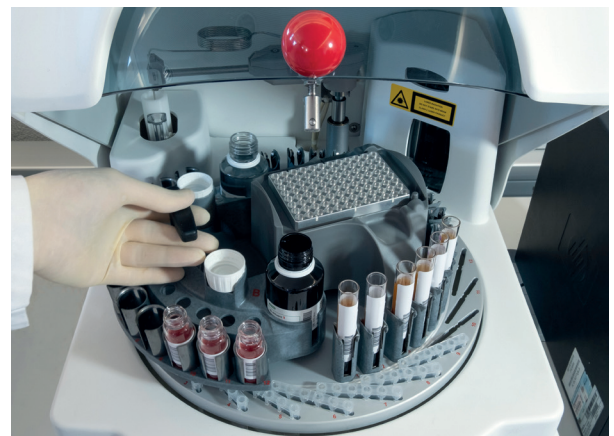
Carrossel removível para reagentes